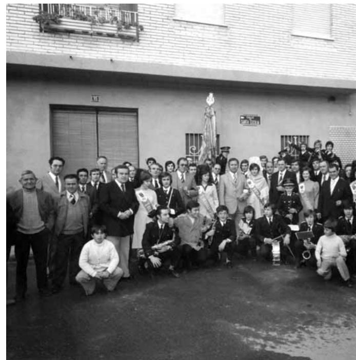
Celebració de Santa Cecília al carrer del seu nom.