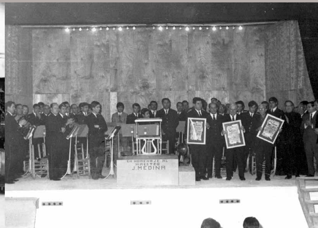
La banda de música i les autoritats del poble durant un homenatge al Mestre.