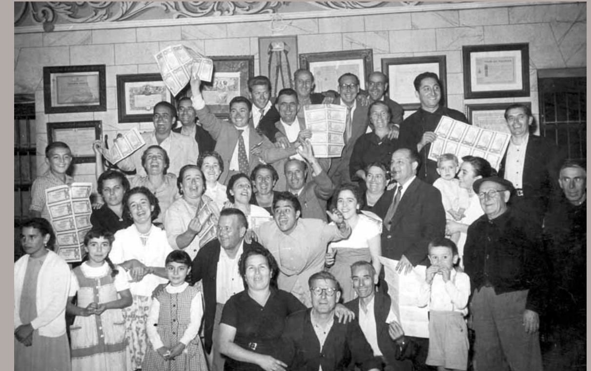
Tothom coincideix amb la idea que el premi de la loteria va representar un gran impuls en la construcció del Musical. No obstant, abans d'aquest esdeveniment, la Secció Femenina de la Societat ja constituïa un pilar bàsic de suport a la Societat Musical.