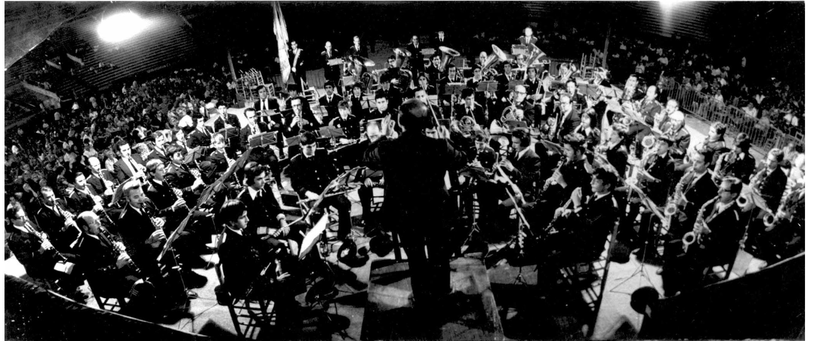
Imatge de la Banda de la UMA durant un certamen a la Plaça de Bous.