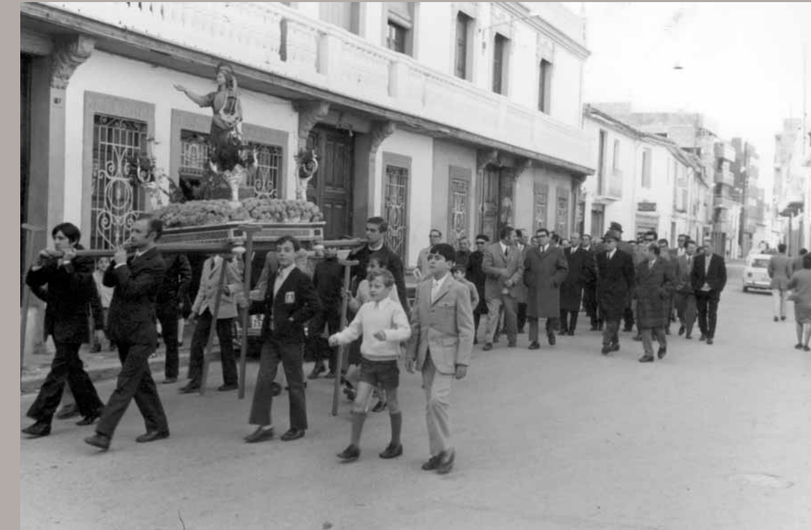
Cercavila amb Santa Cecília, passant per davant de l'Ateneu.

Estem parlant de fa molts anys perquè nosaltres eixírem a tocar en 1943 en un certamen que es celebrà a Múrcia, i allí eixírem per primera vegada, als 14 anys d'edat. El més xocant de la banda no era la burla que feia la gent, perquè jo pense que la burla no anava dirigida a les persones sinó a una situació complicada, que jo d'alguna manera puc entendre. Fins la guerra havien hagut tres bandes i cadascuna havia tingut la seua bandera, i es pogueren recopilar les dos banderes, la vella de la Música Roja, que deien, i la nova, que havia sigut del Centro de Socorros Mútuos. Les dos banderes recuperades es van unir ajuntant-les en una sola de dos cares on quedaven representades les dos