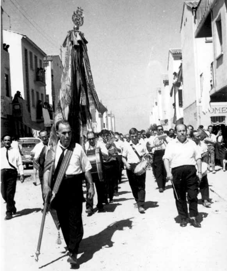
La Banda de la UMA recorrent el recentment inaugurat barri del Carme.