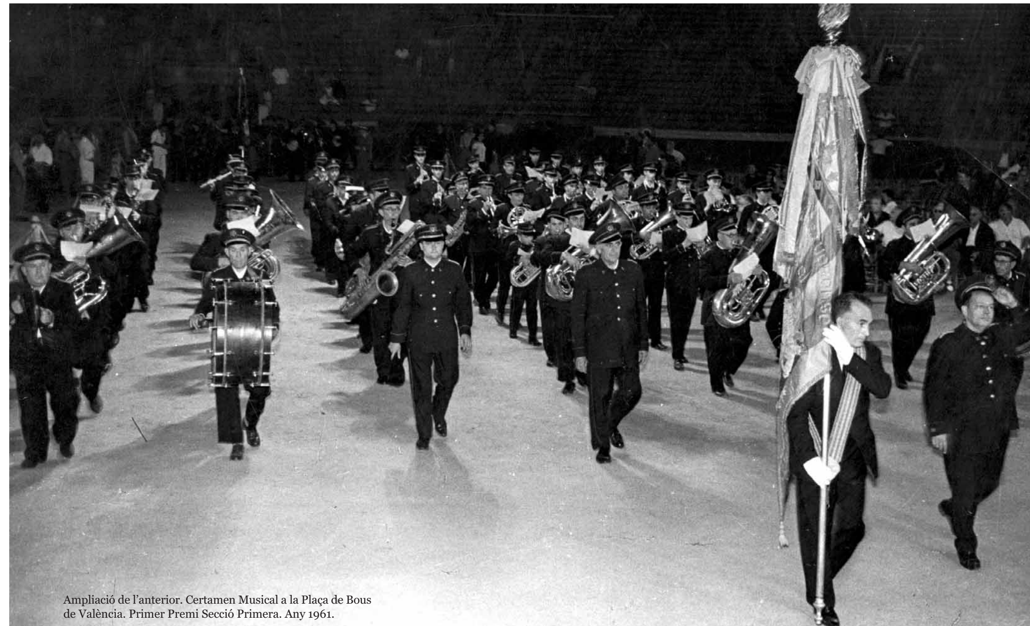
Ampliació de l'anterior. Certamen Musical a la Plaça de Bous de València. Primer Premi Secció Primera. Any 1961.