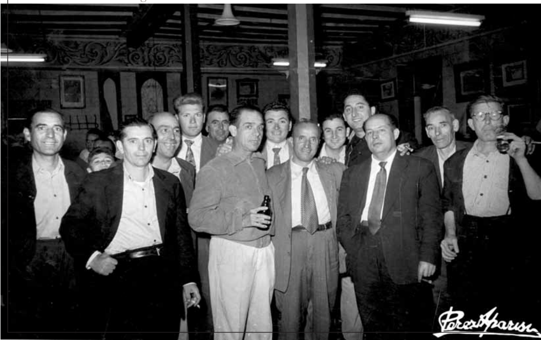
El Mestre gaudeix d'un bon moment amb els amics.